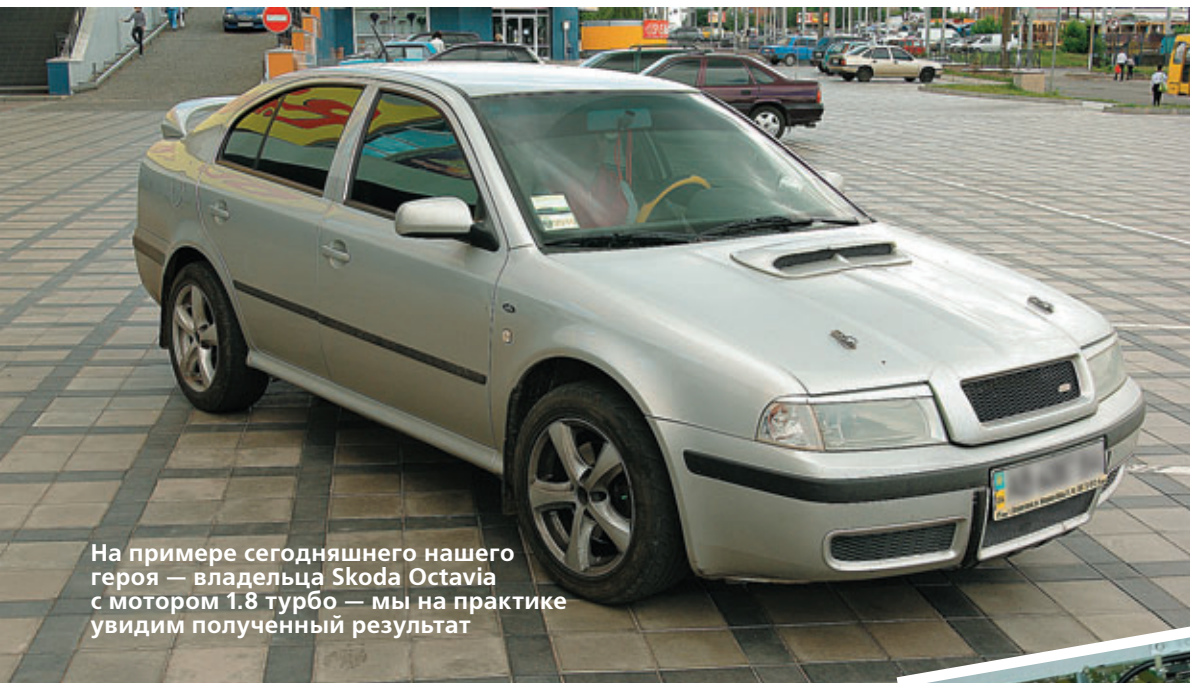
На примере сегодняшнего нашего героя — владельца Skoda Octavia с мотором 1.8 турбо — мы на практике увидим полученный результат